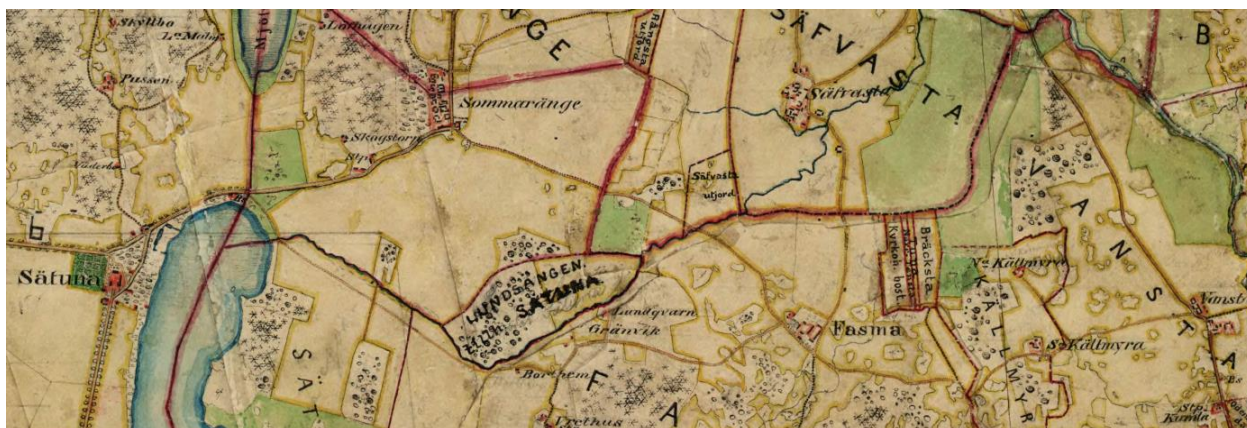
Bild nr 1. Häradsekonomska kartan